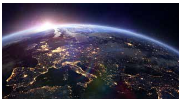
400 сотрудников, работающих с клиентами