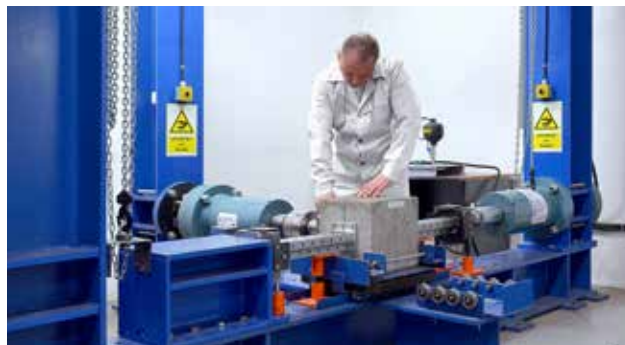
Собственная тестовая лаборатория

У работает 1300 сотрудников в Европе. Мы также представлены в Европе и во многих частях мира, таких как Африка, Ближний Восток, США и Южная Америка, с обширной дистрибьюторской сетью. Независимо от того, где вы находитесь, мы всегда рядом.